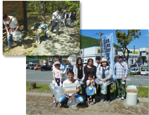
5/27 波志江沼環境ふれあい公園周辺清掃活動