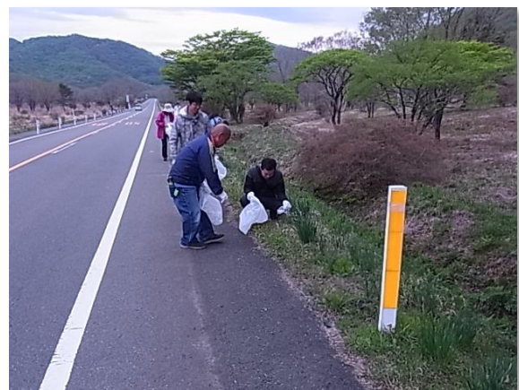
5/13 榛名湖畔周辺清掃活動