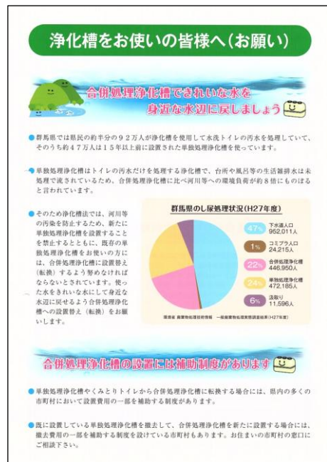
四団体の啓発チラシ 3万枚配布