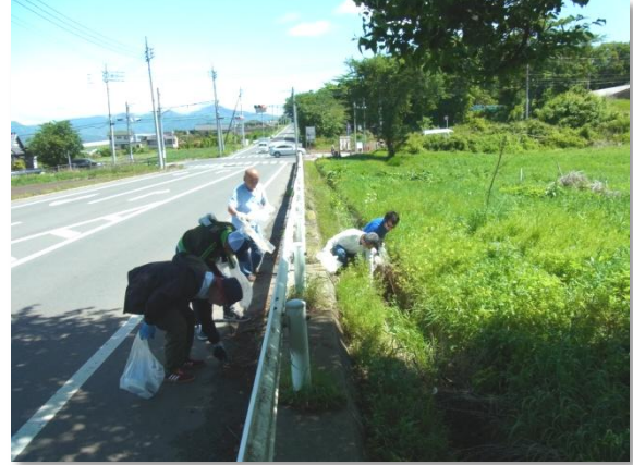
5/19 昭和村総合運動公園周辺清掃活動