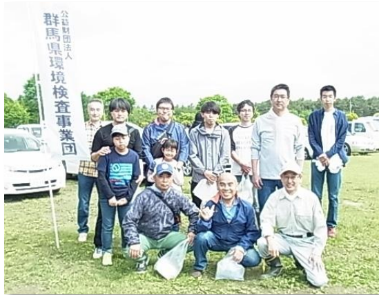
5/19 昭和村総合運動公園周辺清掃活動 参加者 12 名