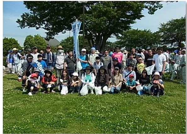
5/26 波志江沼環境ふれあい公園周辺清掃活動 参加者 32 名