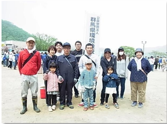
6/2 あかぎ大沼周辺清掃活動 参加者 12 名