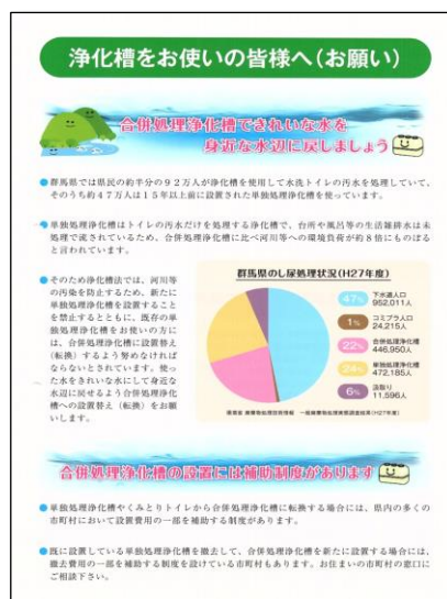
四団体の啓発チラシ 3万枚配布