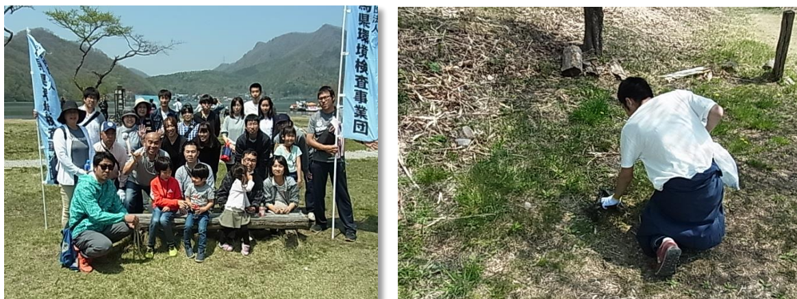
5/12 榛名湖畔周辺清掃活動 参加者 27名

令和元年5月12日から6月2日の間、県内4ヶ所において群馬県及び地域機関が主催する環境美化活動にのべ83名の職員及び職員の家族が参加し、清掃活動や啓蒙活動を行った。