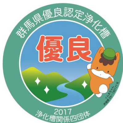
優良浄化槽認定シール