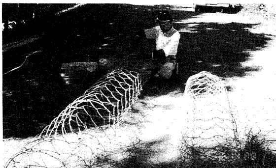
写真 1-4 組立て状況