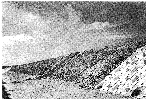
写真 1-2 施工前