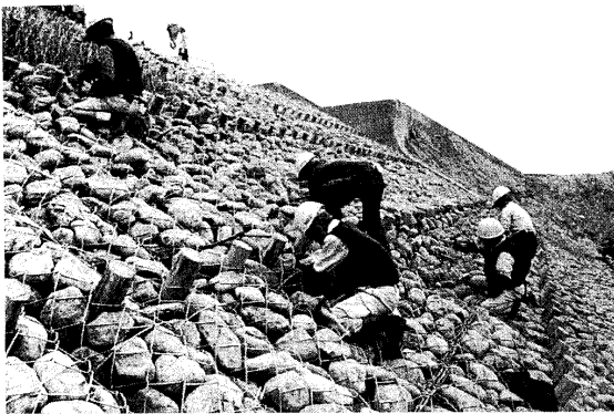
写真 1-6 中詰め状況