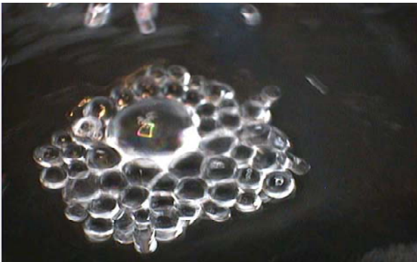
【図5】 水玉が合体していく様子