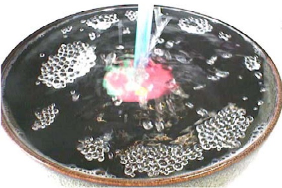
【図4】 水玉が数多く発生しする様子