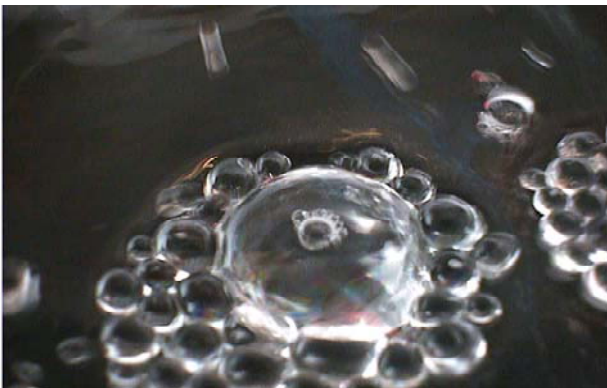
【図6】 さらに大きくなる様子

注意：空気の泡ができないように振動させる。また、この写真は空気の泡ではなく、水玉であるが、互いに吸収し直径2cmの水玉にもなる。