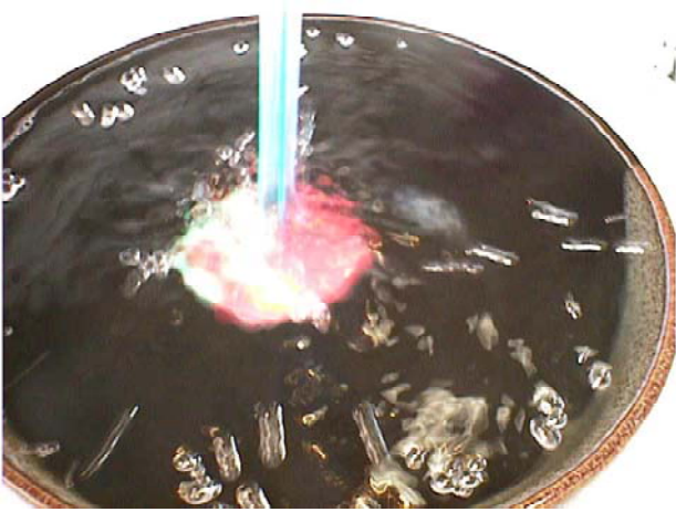
【図3】 振動発生部位に振動を与えた瞬間